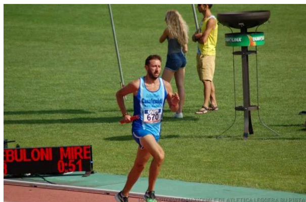
10° CAMPIONATO NAZIONALE DI ATLETICA LEGGERA SU PISTA