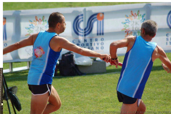
10° CAMPIONATO NAZIONALE DI ATLETICA LEGGERA SU PISTA