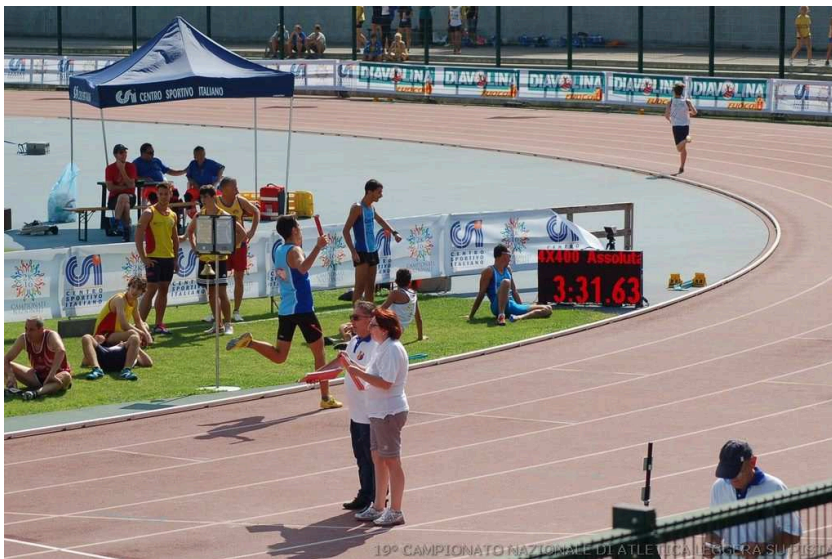
Arrivo della 4x400 Maschile. Che tempo!