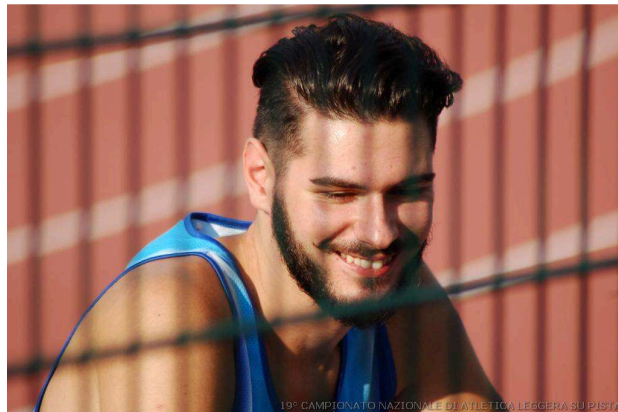
Simone discobolo e valido staffettista